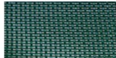
400 g Kunststoffummanteltes PE-Gittergewebe