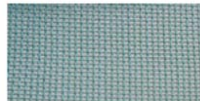
260 g Nylongewebe